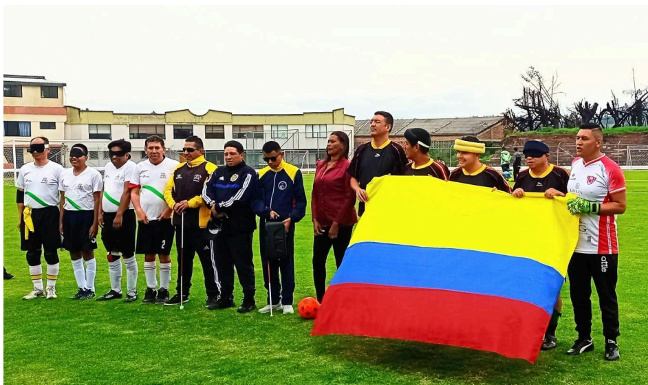
Figura 2. Actividad “Compartiendo experiencias”

esférico, elaborado de material sintético, cuenta con cascabeles en su interior que emiten una señal auditiva al desplazarse dentro del terreno de juego o al ser golpeado por los deportistas. Además, el guardameta dispone de un área de 2 metros donde puede intervenir con normalidad; sin embargo, si participa en la dinámica de juego fuera de esta zona, el árbitro sanciona la infracción con un penalti desde 6 metros de distancia.