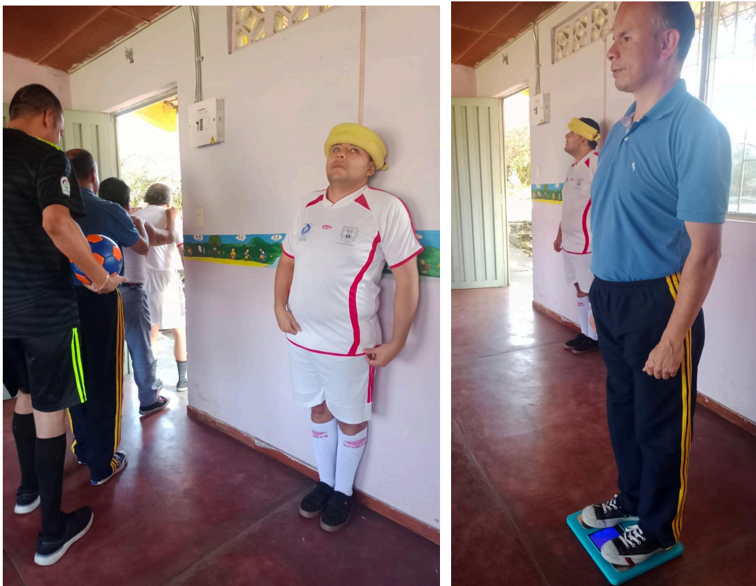
Figura 1. Actividad “Conociendo mi cuerpo”